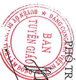
Phạm Thành Đồng